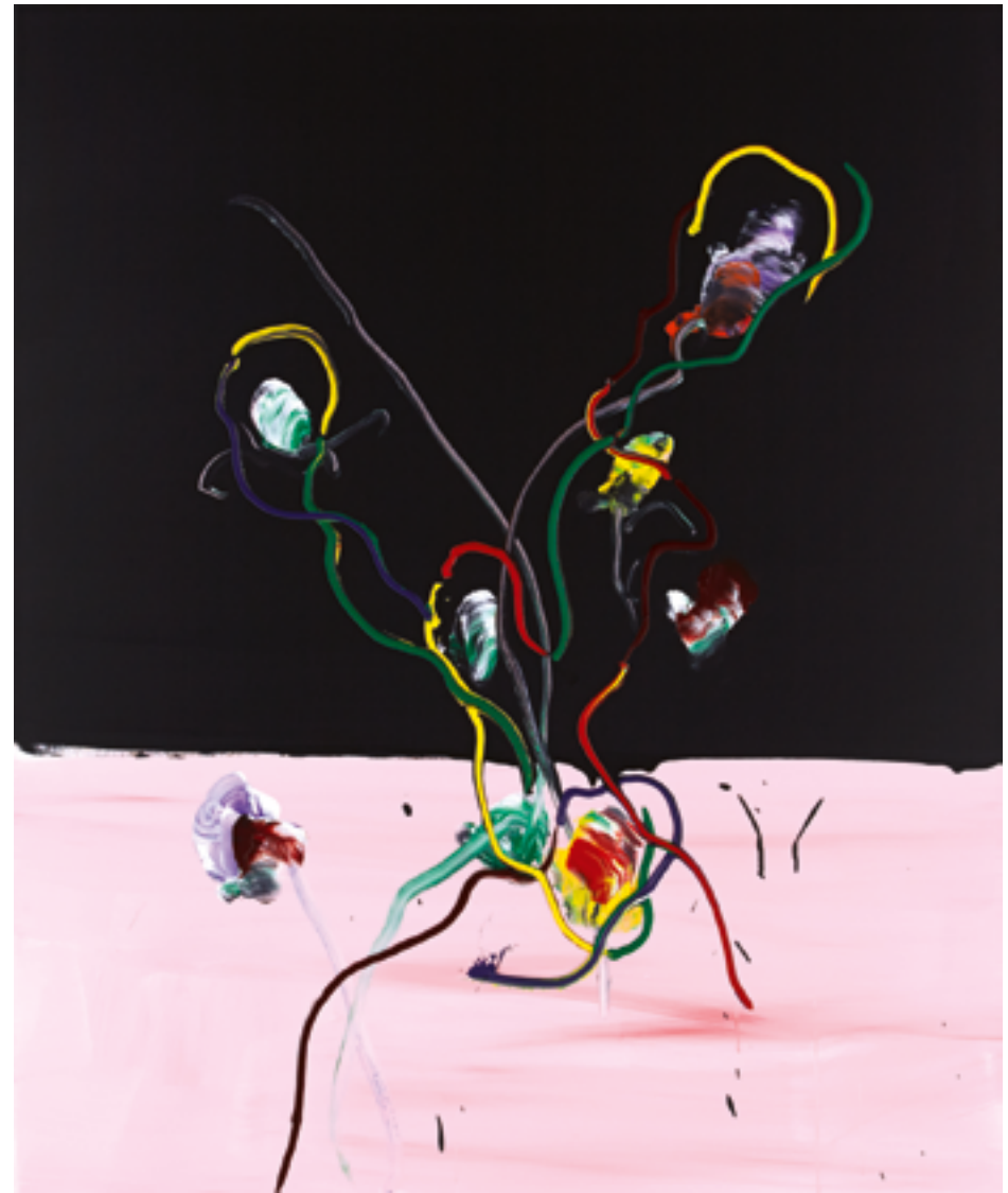
poem 2014 21298.2 acryl auf baumwollgewebe 120 x 100 cm