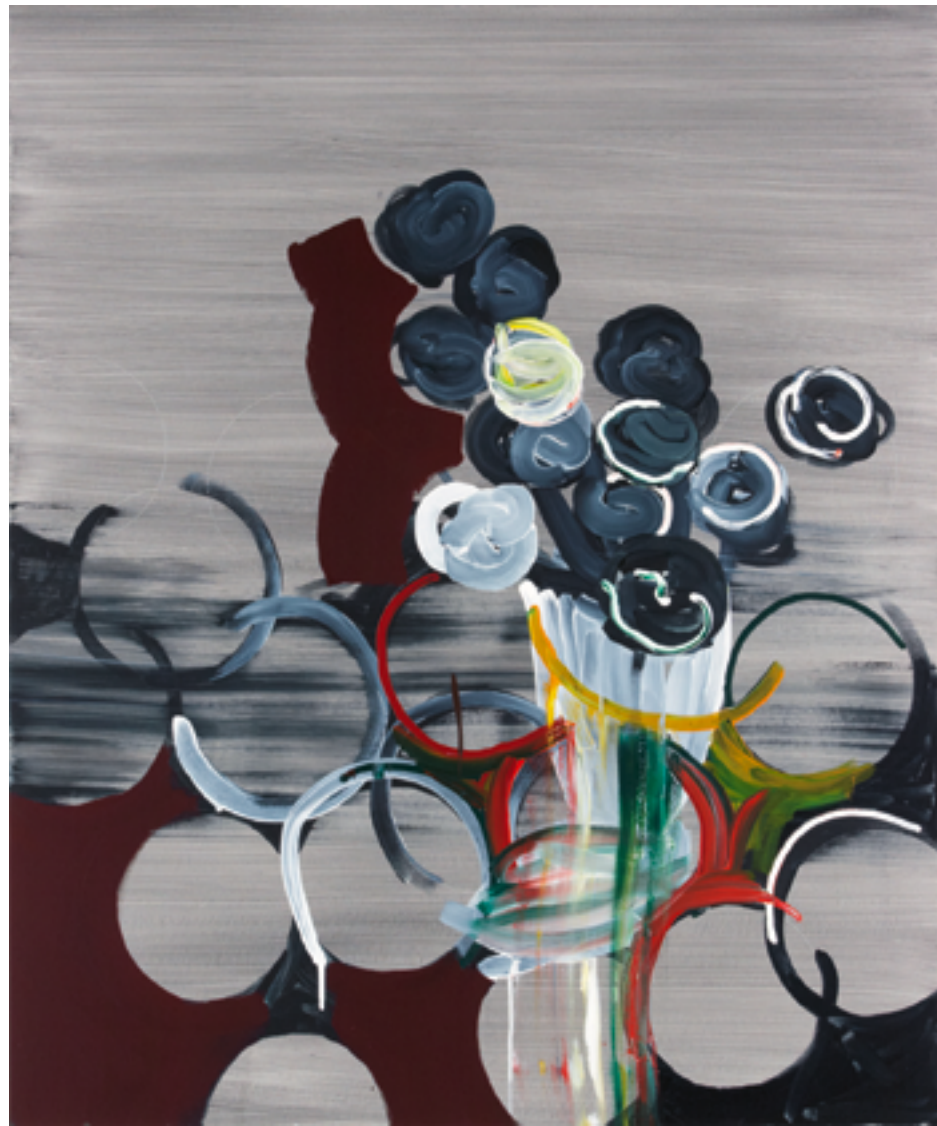
blumen in vase 2013 20877 acryl auf baumwollgewebe 120 x 100 cm