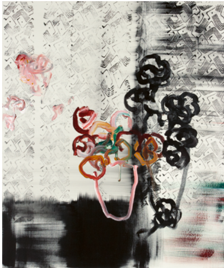
blumen in vase 2013 20844.2 acryl auf baumwollgewebe 120 x 100 cm