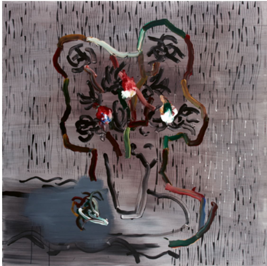
blumen in vase 2013 21018 acryl auf baumwollgewebe 140 x 140 cm