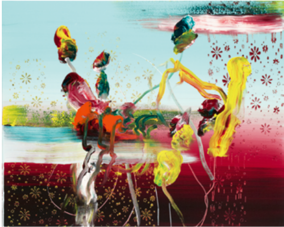
poem 2013 21014.2 acryl auf baumwollgewebe 80 x 100 cm