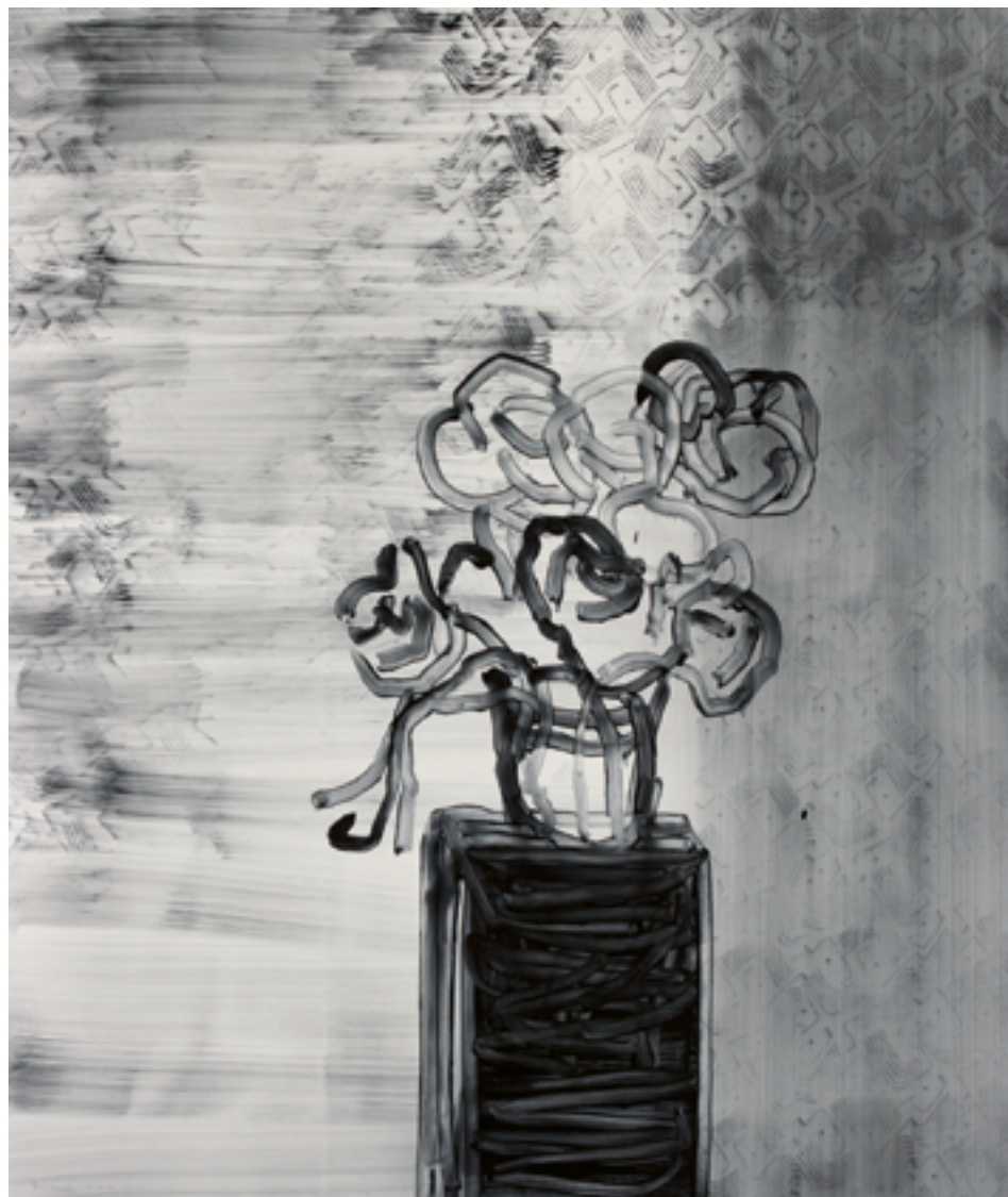
blumen in vase 2013 20842 acryl auf papier 130 x 110 cm