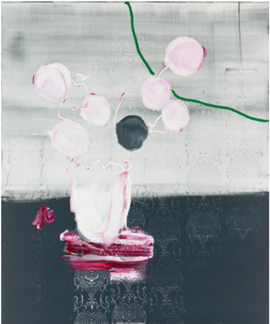
blumen in vase 2014 21235 acryl auf baumwollgewebe 120 x 100 cm