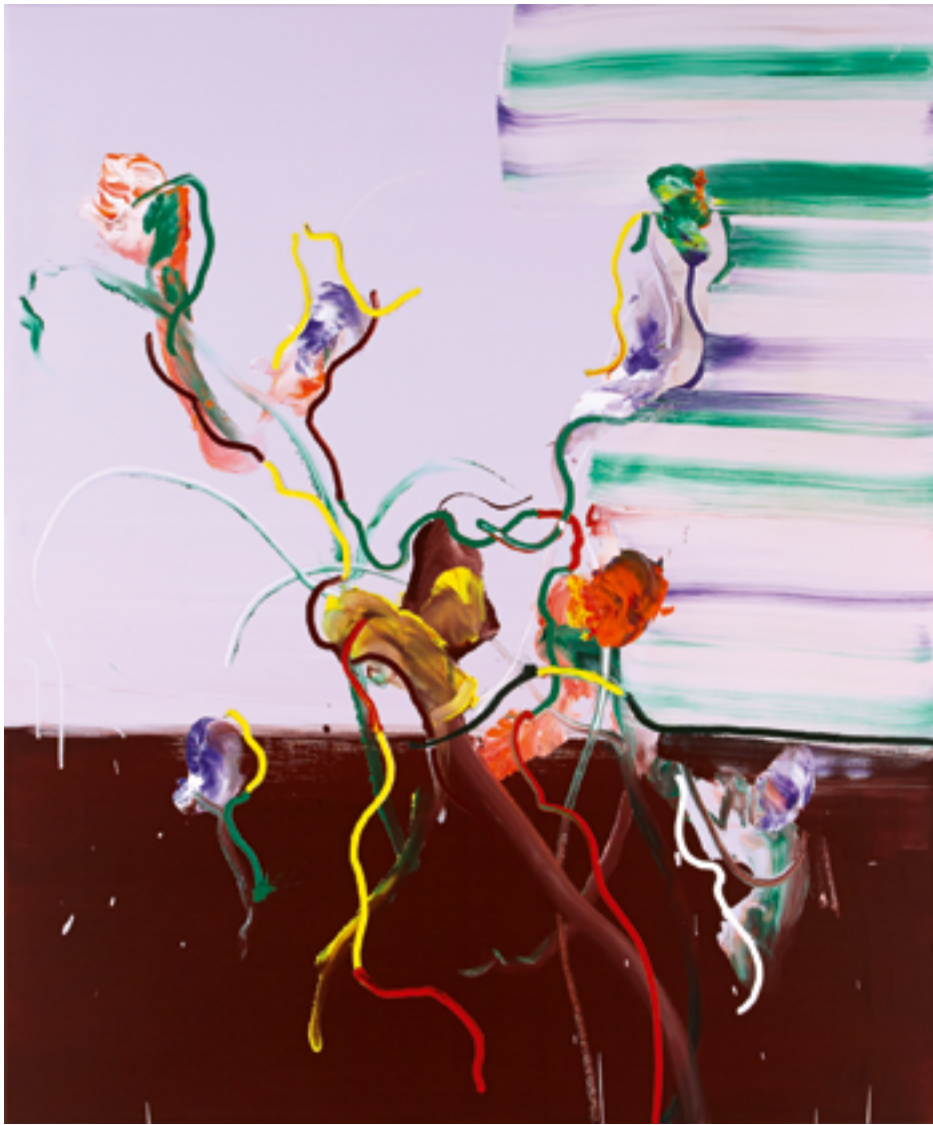
poem 2014 21298.3 acryl auf baumwollgewebe 120 x 100 cm