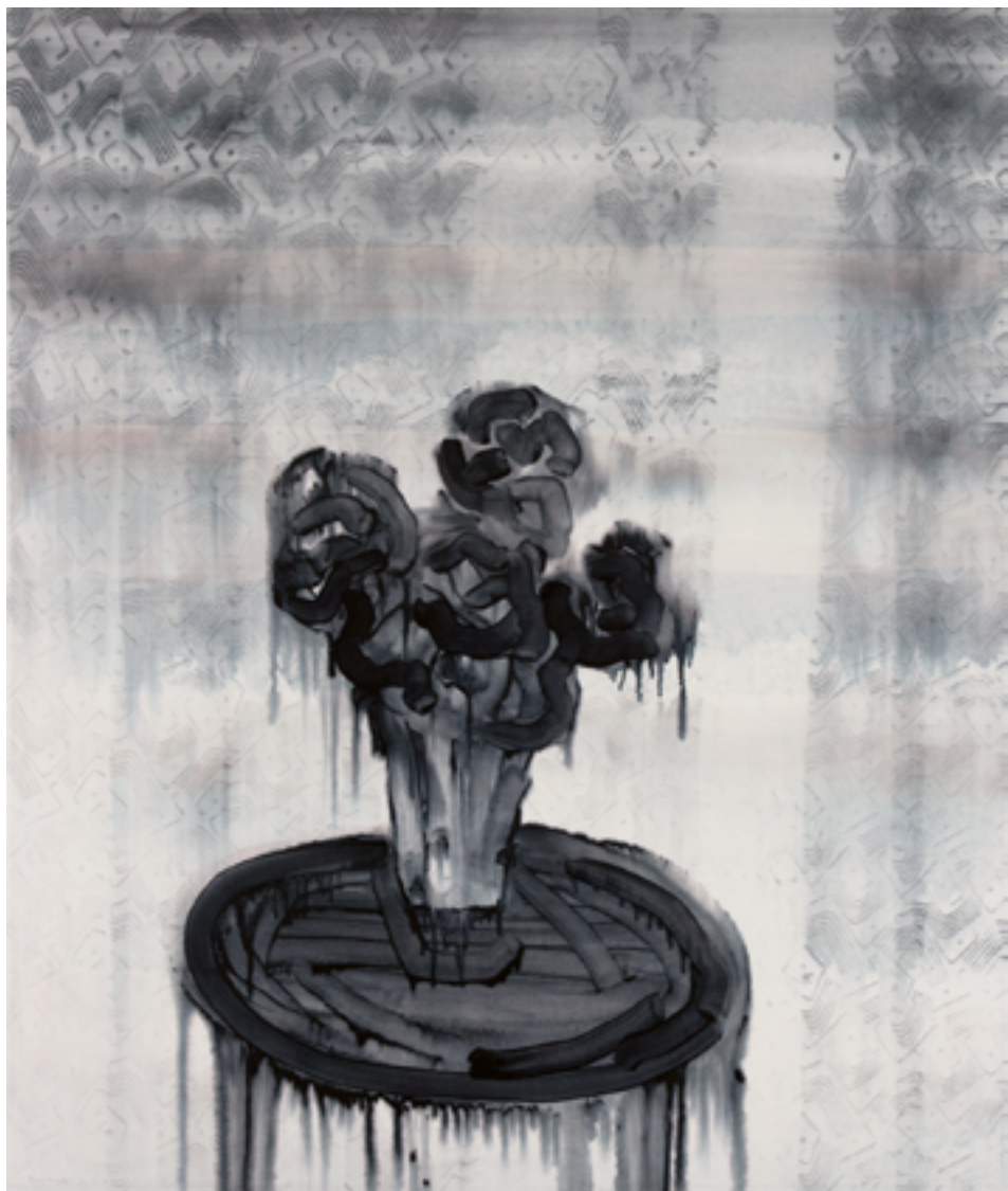
blumen in vase 2013 20840.1 acryl auf papier 130 x 110 cm