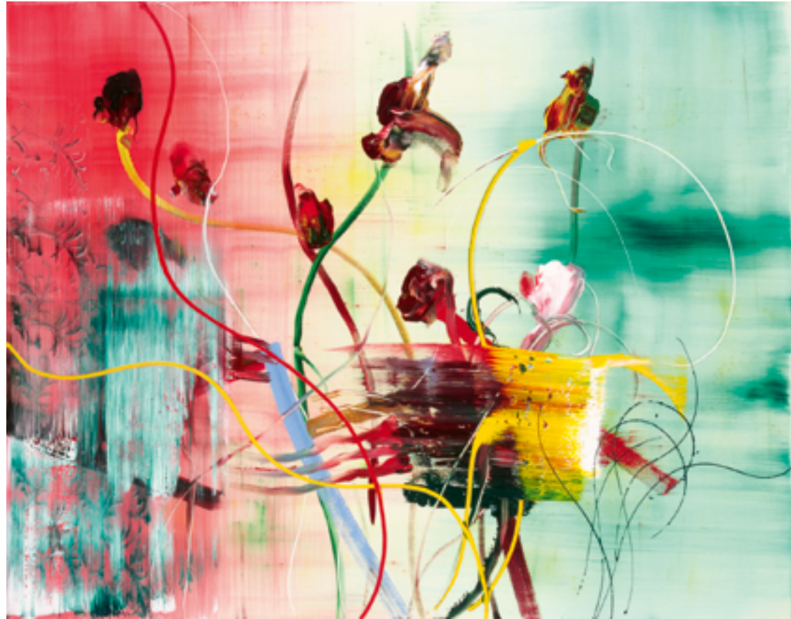
poem 2013 21059.2 acryl auf baumwollgewebe 110 x 140 cm umschlag rückseite blumen in vase 2013 20840.2 acryl auf papier 130 x 110 cm