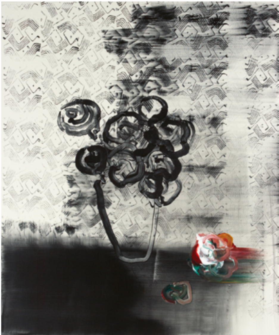
blumen in vase 2013 20844.1 acryl auf baumwollgewebe 120 x 100 cm